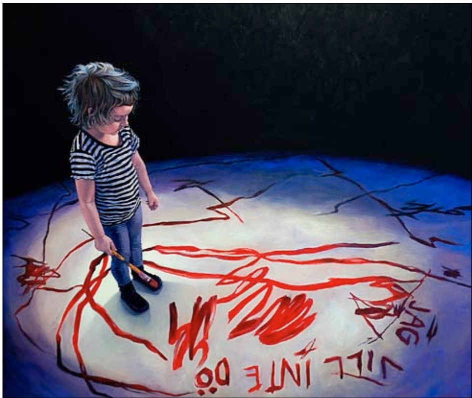
”UTAN TITEL (JAG VILL INTE DÖ)”. Tre Tillema-målningar visar ett barn som påminner om det klassiska ”gråtande barnet”.